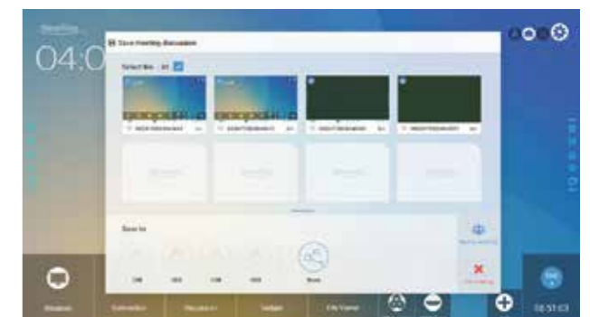
Comparte por Email o pendrive sólo con un click.