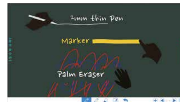
Mejora la comunicación con la pizarra de anotaciones.