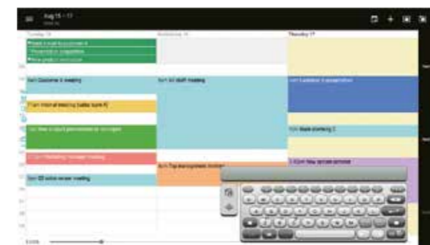
Función de agenda para reservas de sala de reuniones.