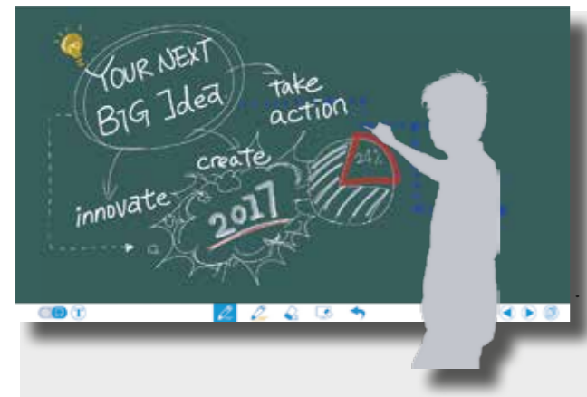
IMAGEN CLARA Y ROBUSTA

La Serie X utiliza la última tecnología de optical bonding , lo que reduce los reflejos consiguiendo un contraste mejorado y eliminando el paralaje.