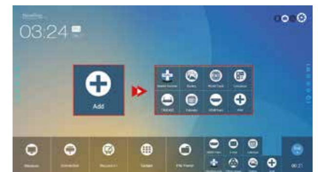
Hazte un experto con su interfaz intuitiva.