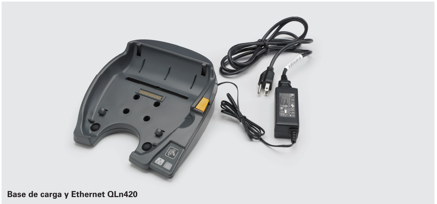
Base de carga y Ethernet QLn420